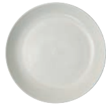
プレートM φ160 x 28 ¥1,200 クリーム・M29801 オリブ・M29802