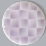
P42102 螺鈿 RADEN