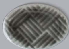
P43201 石畳 ISHIDATAMI