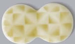
P43003 三角格子 SANKAKU KOSHI