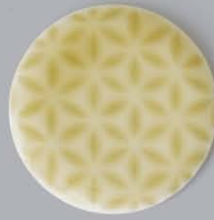
P41203 雪花紋り YUKIHANASHIBORI