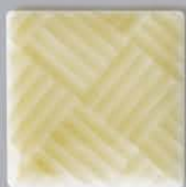
P42603 石畳 ISHIDATAMI