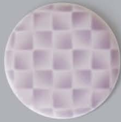
P41102 螺鈿 RADEN