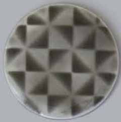
P41001 三角格子 SANKAKU KOSHI