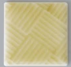
P41603 石畳 ISHIDATAMI