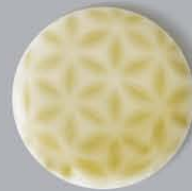
P42203 雪花紋り YUKIHANASHIBORI

ピアス 丸 φ15×3 四角 13×13×3 三角 14×13×3 各¥3,000 (ペア)