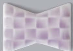
P43102 螺鈿 RADEN