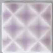
P42502 折り紙 ORIGAMI