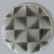
P42001 三角格子 SANKAKU KOSHI